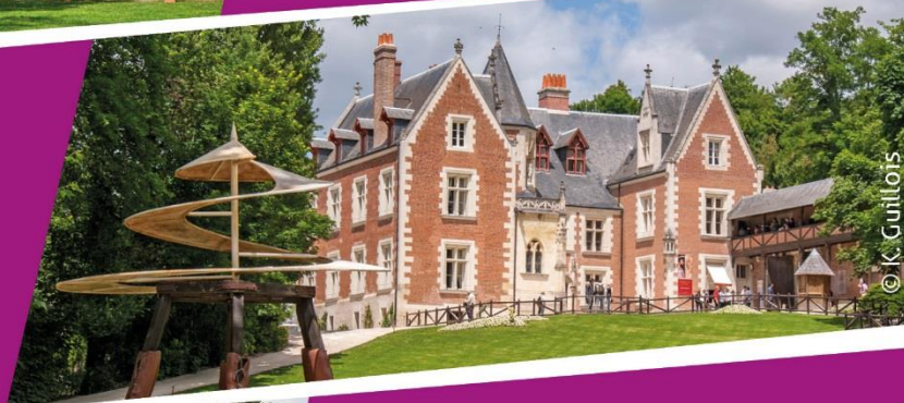
Clos Lucé Amboise