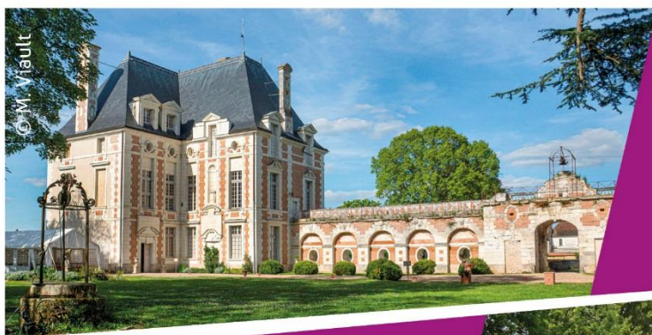
Château de Selles-sur-Cher