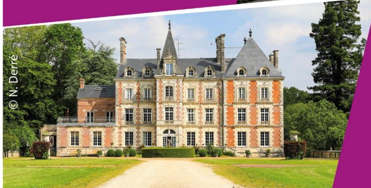
Château des énigmes Fréteval

UNE INITIATIVE DE VOTRE CONSEIL DÉPARTEMENTAL