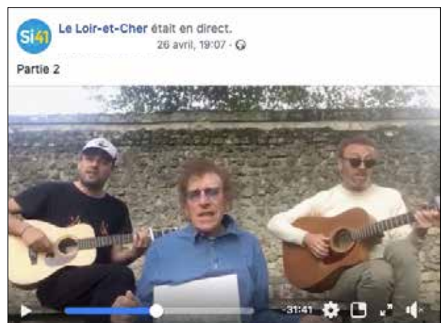
Intervention d'Alain Souchon et ses fils lors de la « Faites de la musique »