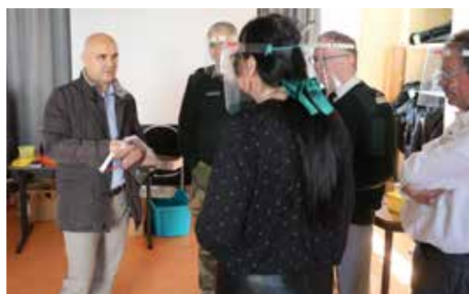
▲ Visite de l'atelier DMD de confection de visières