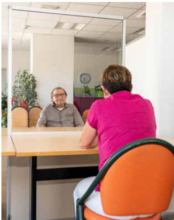
▲ Parloir à l'Ehpad Les Maronniers à Mondoubleau