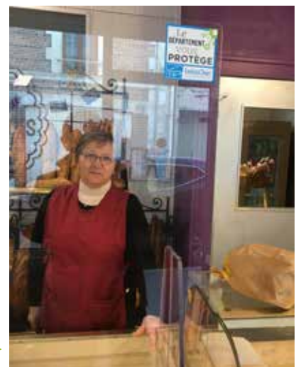
▶ Commerçante équipée d'un plexiglas de protection