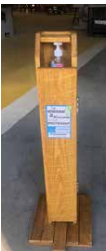
◀ Distributeur de gel hydro-alcoolique

La majeure partie des équipements produits ou achetés ont été distribués par les élus dans leur canton auprès des populations ; des masques et kits de protection ont été remis aux agents afin qu'ils puissent poursuivre leurs activités.