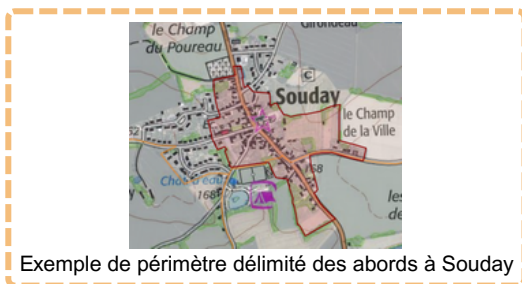
Exemple de périmètre délimité des abords à Souday

Les abords de monuments historiques correspondent généralement à un périmètre de 500 mètres autour des monuments. Ces périmètres sont amenés à être modifiés administrativement, auquel cas ils deviendront des "périmètres délimités des abords". Il est possible de consulter les zones concernées en ligne sur l' Atlas des patrimoines .