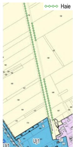
Exemple de haie identifiée comme à préserver ou à créer dans le PLUi-HD d'Agglopolys - commune de Marolles