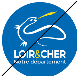
Changer la forme