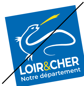
Incliner le bloc