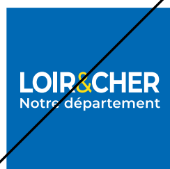
Dissocier les éléments