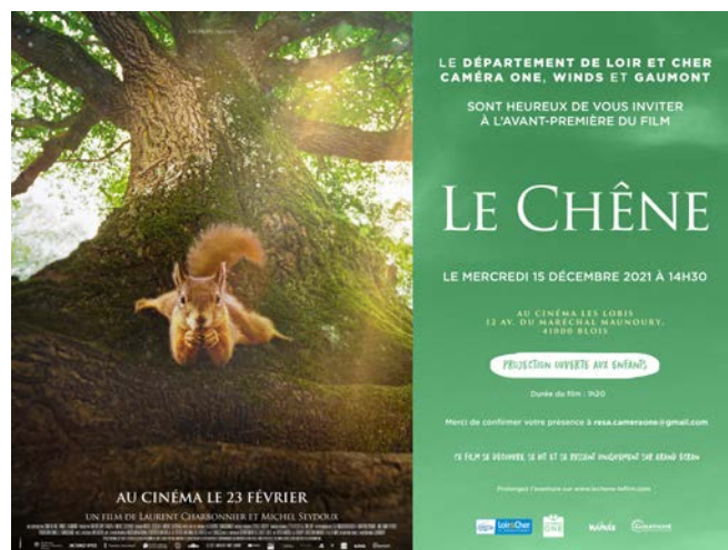
Exemple de carton d'invitation