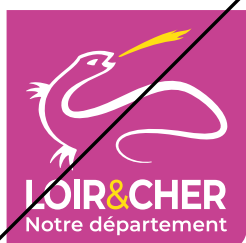
Changement de couleur