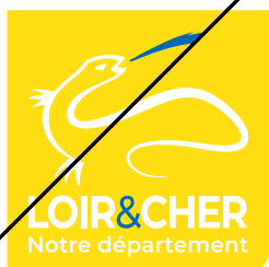
Inverser les couleurs

Exemples des transformations du logo interdites :