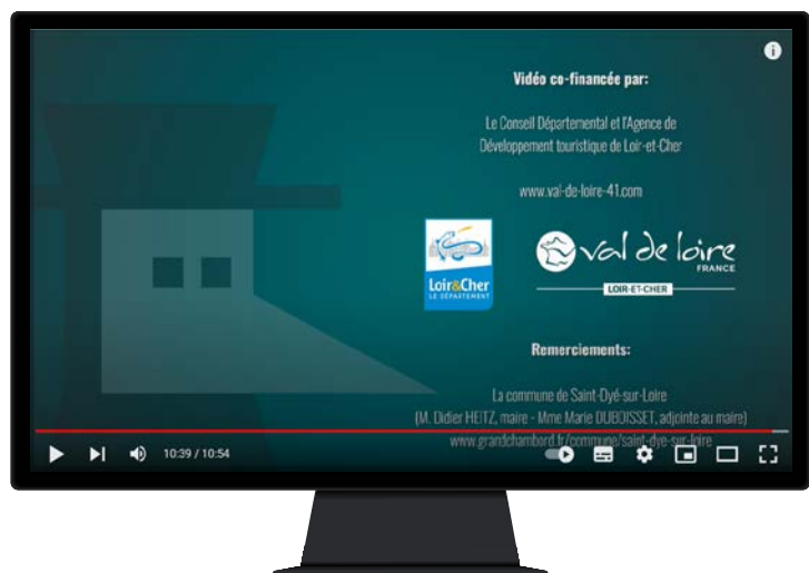
Exemple de vidéo