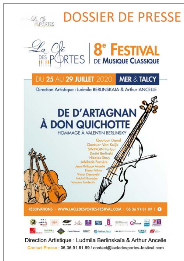
Exemple de dossier de presse