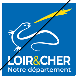
Changement de proportions