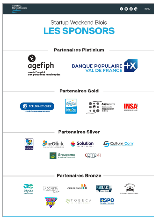
Exemple de communiqué de presse

Selon l'importance du projet et à la discrétion du conseil départemental, vous pouvez demander une interview d'un élu pour l'intégrer dans votre publication.