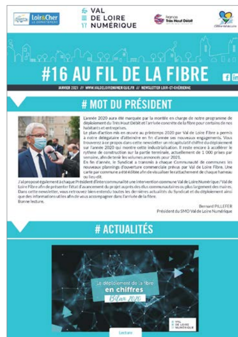
Exemple de Newsletter